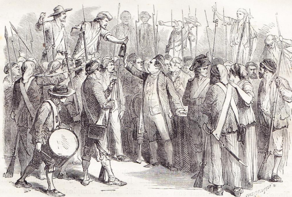
JOURNÉE DU 20 JUIN 1792. — Louis XVI buvant à la nation.

scrits, attaquer de front les 160 000 Prussiens et Impériaux que commandait Brunswick, il les attendit dans les défilés de l'Argonne, qu'il appelait « les Thermopyles de la France », et il fut plus heureux que Léonidas.