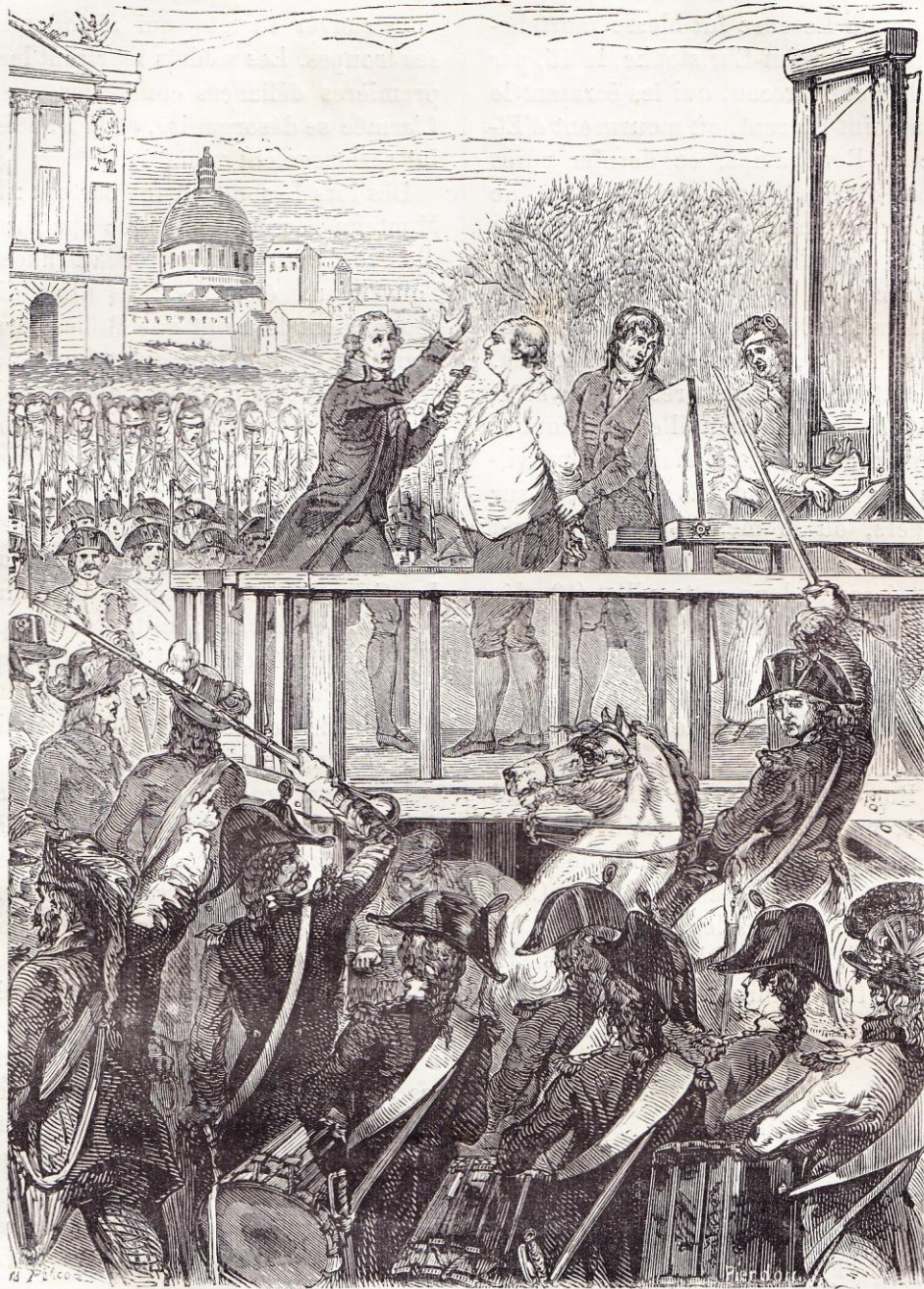
Louis XVI à l'échafaud (d'après les estampes du temps).